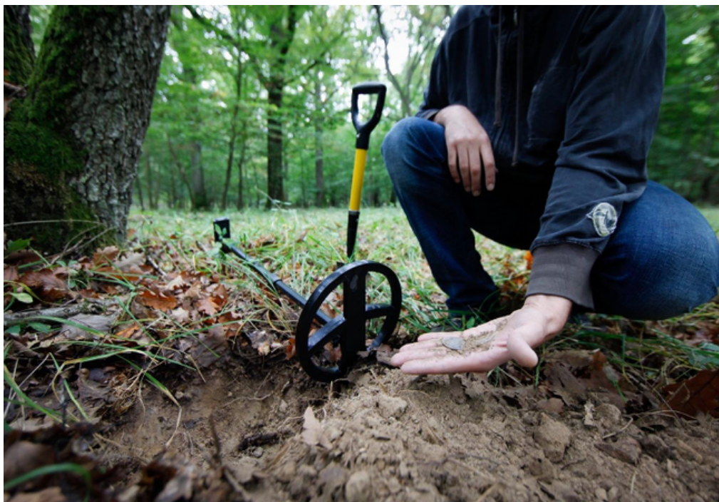
Utilisation d'un détecteur de métaux

Forêts, plages, champs agricoles, pâturages... Tout au long de l'année, partout sur le territoire, des utilisateurs de détecteur de métaux s'investissent pleinement et régulièrement dans le nettoyage des déchets métalliques, intimement convaincus qu'ils agissent pour préserver l'homme, l'environnement, la faune et la flore. En libérant ainsi les sols des déchets métalliques, les prospecteurs de métaux localisent les zones polluées par des métaux lourds comme le plomb, le zinc, le cuivre... Ils évitent la dissolution de ces métaux dans les sols, pouvant occasionner des effets graves sur la santé humaine, les animaux, les plantes, la nappe phréatique et l'environnement en général... Ils aident les agriculteurs à retrouver des outils ou des éléments de machines qu'ils égarent et qui peuvent causer des dommages aux pneumatiques ainsi qu'aux machines... Ils évitent l'ingestion de métaux par les bovins (60 000) en sachant que 30 000 d'entre eux meurent chaque année, notamment à cause de l'aluminium des cannettes de boisson... Ils restaurent les écosystèmes endommagés, la dépollution des déchets métalliques enfouis dans les sols permettant à la faune et à la flore de prospérer, contribuant à faire du bien à la planète.