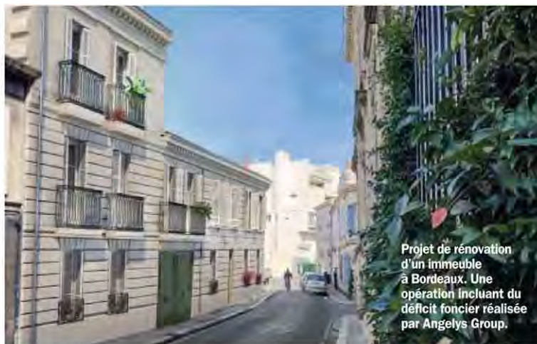
Projet de rénovation d'un immeuble à Bordeaux. Une opération incluant du déficit foncier réalisée par Angelys Group.