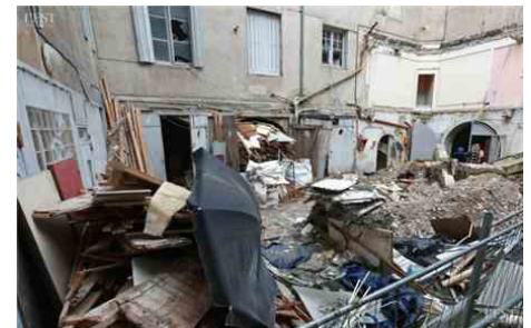
La cour intérieure de l'immense bâtisse du côté de la rue Champrond.

défi technique : on doit restaurer et conserver à l'identique certains éléments tout en essayant de rendre cet immeuble le moins énergivore possible. Mais on a l'habitude de travailler en secteur ancien. Je ne suis pas du tout inquiet. Cette bâtisse est remarquable, son potentiel fabuleux. Quand ce sera terminé, ce sera magnifique. »