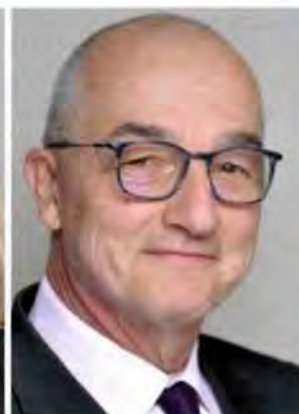
PAR YOURI BURATTI, directeur général monuments historiques, Angelys Group